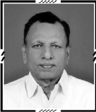
പ്രസാധകൻ : Dr. പപ്പൻ

ഒരു ജാമക്കാരൻ പ്രസിദ്ധീകരണം (പ്രസാധകൻ : Dr. പപ്പൻ , സേലം-5) പ്രസാധക കുറിപ്പ്