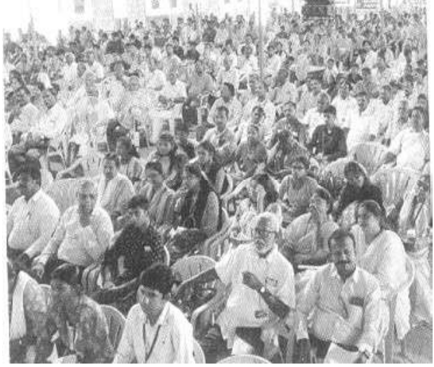
மாநாட்டிற்கு வந்த கூட்டங்களில் ஆண்கள் பகுதி

நீங்கலாக்கி இளைப்பார்ப்பண்ணினபோது அவன் தன்வீட்டிலே வாசமாயிருக்கையில், ராஜா தீர்க்கதரிசியாகிய நாத்தானை நோக்கி பாடும், கேதுரு மரங்களால் செய்யப்பட்ட வீட்டிலே நான் வாசம் பண்ணும்போது தேவனுடைய பெட்டி திரைகளின் நடுவே வாசமாயிருக்கிறதே ! என்றான் என்று வாசிக்கிறோம். தாவீது தன் வீட்டில் சுகமாக இளைபாறிக் கொண்டிருக்கும் சமயம் தாவீதின் எண்ணம் எங்கே செல்கிறது பாருங்கள்! நான் விலையுயர்ந்த அழகாய் அலங்கரிக்கப்பட்ட கேதுரு மரத்தாலான வீட்டில் வாசம் பண்ணும் போது என் தேவனுடைய பெட்டி திரைகளின் நடுவே கூடாரத்தில் இருக்கிறதே. நான் என் ஆண்டவருக்கு எப்போது ஒரு ஆலயத்தைக் கட்டப்போகிறேன் என்று ஏங்குகிறார். தேவன் நம்