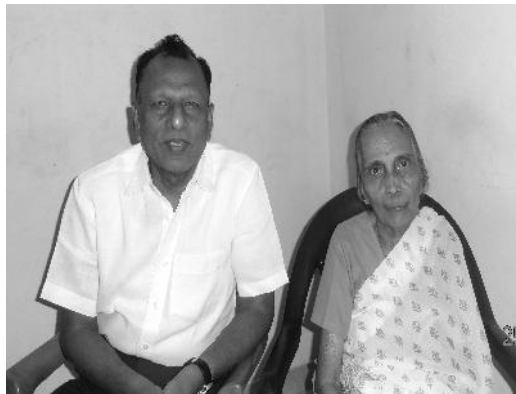
Photo ഞാൻ പ്രസിദ്ധീകരിക്കുന്നു. ദൈവത്തിനും മാത്രം മഹത്വം ഉണ്ടാകട്ടേ!

വടക്കേ ഇന്ത്യയിൽ മിഷണറി പ്രവർത്തനം ചെയ്യുന്ന ദൈവവേലക്കാരുടെ കുടുംബങ്ങൾ പിശാച് ആക്രമിച്ചതുകൊണ്ട് മാനസികരോഗികളായി ഇന്ന് വെല്ലൂർ സി.എം.സി ഹോസ്പിറ്റലിൽ ചികിത്സിച്ചുകൊണ്ടിരിക്കുന്നു. അതുകൊണ്ട്, വായനക്കാരെല്ലാവരും ദൈവവേലക്കാർക്കും കുടുംബത്തിനായും പ്രാർത്ഥനയിൽ താങ്ങണം. ഇപ്രാവശ്യം തിരുപുരത്ത് കൺവൻഷൻ ചെന്നപ്പോൾ അന്ന് സൗഖ്യം പ്രാപിച്ച ആ സഹോദരിയെ നേരിട്ടു കാണുവാനും അവർക്കായി അന്നു ശവസംസ്കാരത്തിനായി ഒരുക്കിയ ആ കുഴിയേയും വീണ്ടും കണ്ടു. ദൈവത്തെ സ്തുതിച്ചു. വായനക്കാർക്കായി ഈ അത്ഭുതം സംഭവിച്ച സഹോദരിയുടെ