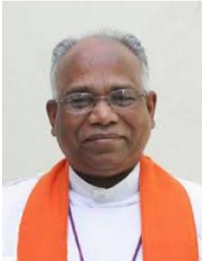
Rt.Rev.Devakatacham Kanyakumari Diocese