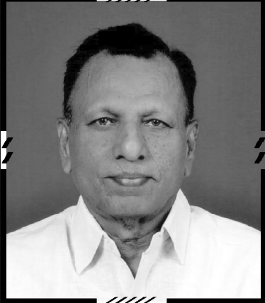
ஸ்தாபகர் - ஆசிரியர்