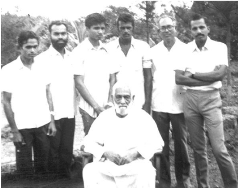
Our 1st Visit to Nilambor 29

ഇങ്ങനെയുള്ള സ്ഥിതിയിലാണ് പ്രസിഡന്റ് ഡോ. ഇടിക്കുളയും അഡ്മിനിസ്ട്രേഷൻ സെക്രട്ടറി അവർകളും, ജനറൽ ബോഡി യോഗം മാറ്റി വയ്ക്കാൻ പഠത്തിട്ടും ഭൂരിപക്ഷ മെമ്പർമാരുടെ അഭിപ്രായത്തിന്റെ അടിസ്ഥാനത്തിൽ ഈ യോഗം നടത്താൻ തീരുമാനിച്ചത്. ഇത് ഇവർക്ക് രണ്ടുപേർക്കും വെറുപ്പും ദേഷ്യവും ഉണ്ടാകാൻ കാരണമായി. വേറെ ചില കാരണങ്ങളും ഇവരുടെ ദേഷ്യത്തിന് പ്രധാന സ്ഥാനം വഹിച്ചു. അതിന്റെ അടിസ്ഥാനത്തിൽ ഇവർ ജനറൽ സെക്രട്ടറി അവർകളെ പല വിഷയത്തിൽ ഭീഷണിപ്പെടുത്തി ബ്ലാക്ക്മെയിൽ ചെയ്യുന്ന വിധത്തിൽ അവർ എഴുതിയ കത്തുകൾ ചിലർ മൂലമായി ഞാൻ അറിഞ്ഞു. ഇത് എന്റെ ഉള്ളത്തിൽ വേദനയുണ്ടാക്കി.